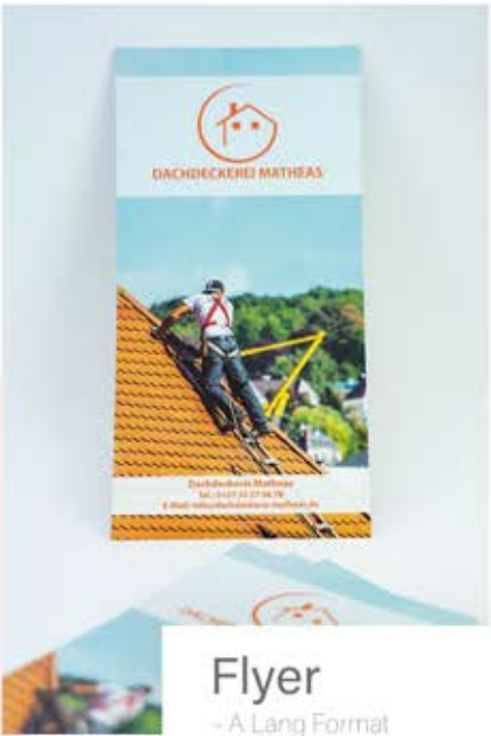
Flyer - A Lang Format - mit 170g Papierstärke - keine Veredelung