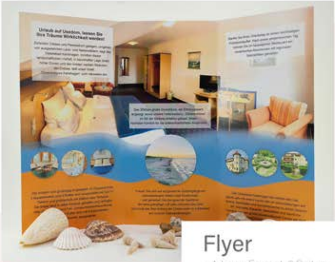
Flyer - A Lang Format, 6 Seiten - mit 260g Papierstärke - Hochglanz Veredelung