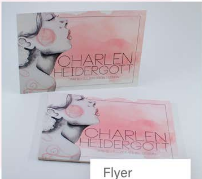
Flyer - A5 Format - mit 220g Papierstärke - keine Veredelung