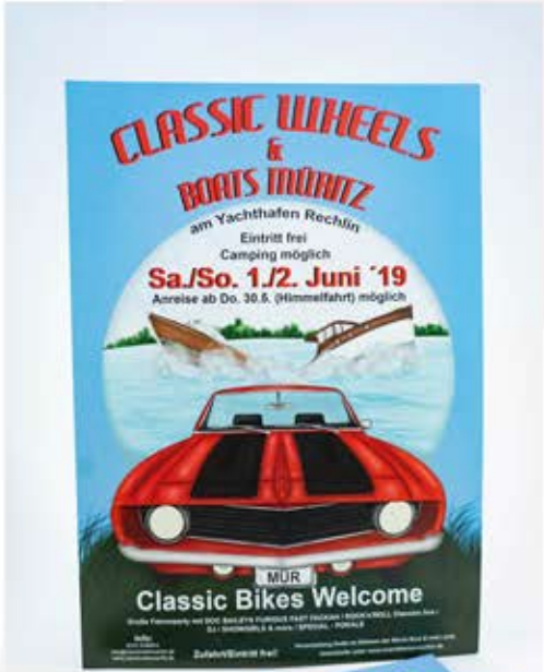
Flyer - A6 Format - mit 280g Papierstärke - Hochglanz Veredelung